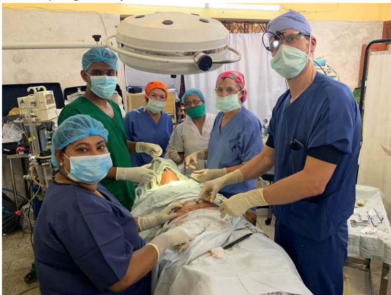
Training on the job

Opleiding en trainingen zijn blijvende belangrijke speerpunten tijdens teamuitzendingen. De artsen, verpleegkundige en/of andere medewerkers krijgen van ons theorie en praktijk aangeboden. Uiteindelijk kunnen ze operaties zelfstandig uitvoeren en andere collega's opleiden. De deelnemende lokale arts en/of fysiotherapeut verricht de nazorg bij de geopereerde patiënten. Helaas is er soms onduidelijkheid over de nazorg en is het niet altijd duidelijk wie er verantwoordelijk voor is en of de nazorg daadwerkelijk plaats vindt. Het is onze ambitie om te zorgen dat deze nazorg door de lokale staf uitgevoerd wordt. Hier wordt extra op ingezet tijdens de overdracht.