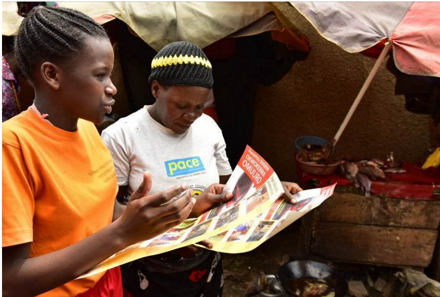
Voorlichting in sloppenwijk in Kampala

Wij willen met lokale partners de brandwondenpreventieprogramma's voortzetten en uitbreiden.