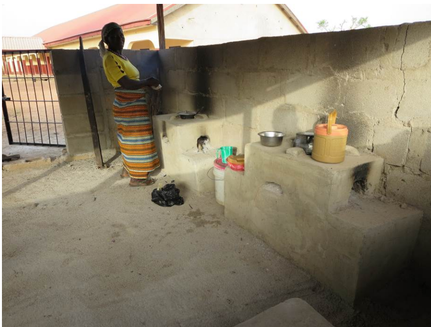
Afgeschermd kookplaats (Nigeria)