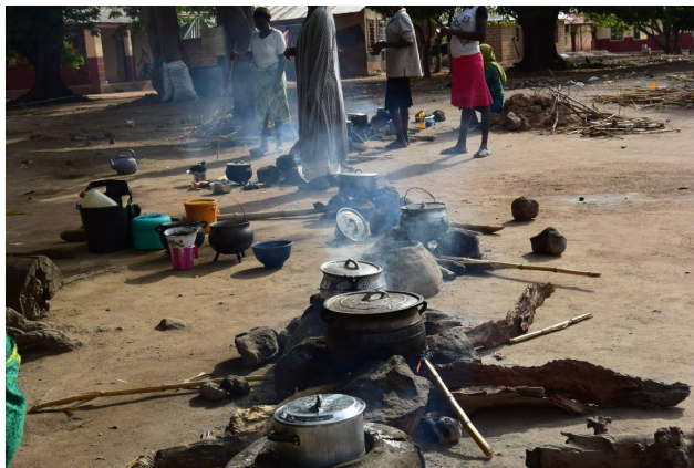
Koken op open vuur! Grootste oorzaak brandwonden in Afrika

Maandag was de grote screeningsdag op de polikliniek. Mensen komen meestal van heinde en verre hiervoor. Er stonden dan ook honderden mensen geduldig te wachten tot ze aan de beurt waren. Wederom werden heel veel patiënten met ernstige brandwondcontracturen gezien. Het is te hopen dat het met steun van Interplast opgezette preventieprogramma zijn vruchten af zal gaan werpen.