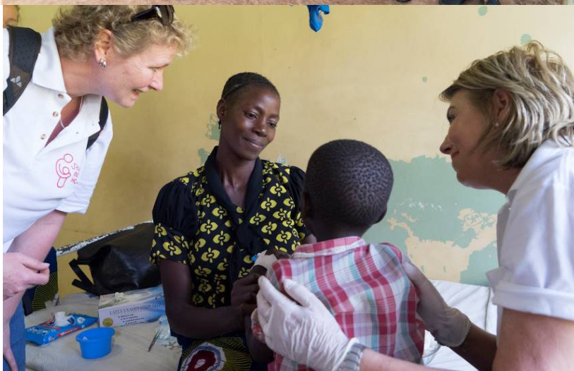
Moeder blij met het resultaat na een lipspleet operatie

Ook zondag werd nog geopereerd. Een jonge man met een brandwond op zijn voet die al overal was geweest maar zonder succes was behandeld. Zoals in zoveel Afrikaanse ziekenhuizen heeft men ook hier (nog) niet geleerd een huidtransplantatie te verrichten.