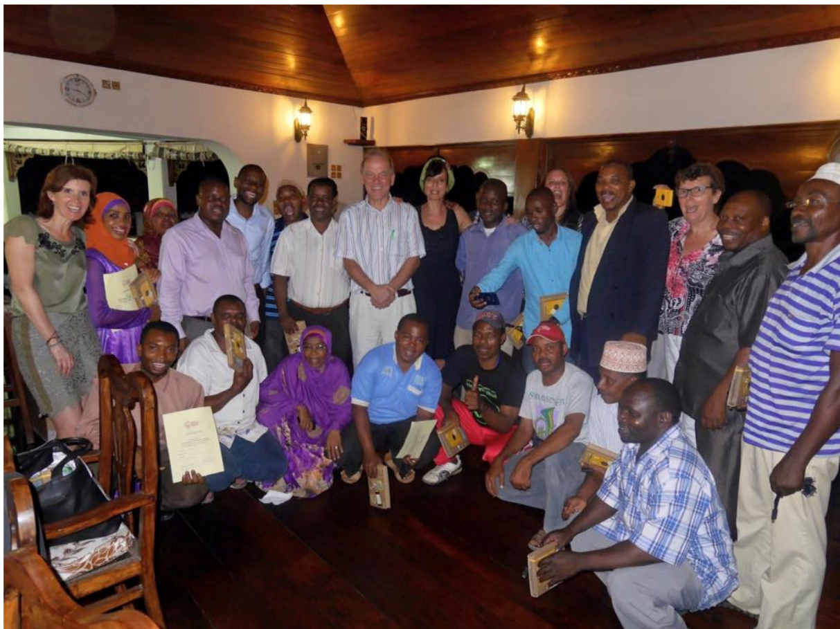
Blij met de WakaWaka lampen